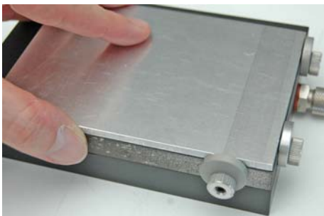
Abb. 5: Werkstück spannen